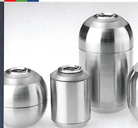
Kameraköpfe von \varnothing 15,5 - 32 mm